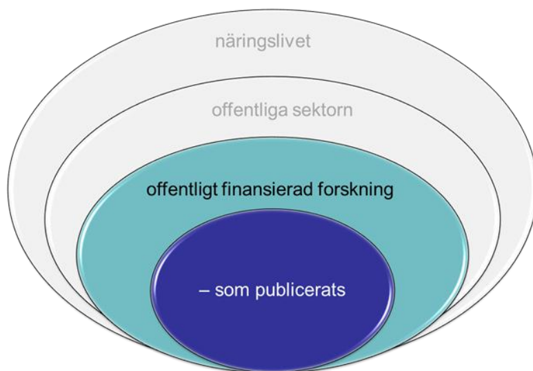
Figur 1. Forskare kan använda data från många olika källor. De föreslagna riktlinjerna adresserar de två innersta ringarna, d.v.s. data som tas fram genom offentligt finansierad forskning. För de kommande fem åren snävas riktlinjerna in ytterligare till att enbart omfatta forskningsdata som tas fram med offentliga medel och som ligger till grund för en vetenskaplig publikation.

De föreslagna riktlinjerna fokuserar enbart på data som tas fram i forskningssyfte och med offentlig finansiering (de två inre ringarna i figur 1). Vetenskapsrådet konstaterar dock att det finns många andra datakällor, inom näringsliv och den offentliga sektorn (de två yttre ringarna i figur 1), som är viktiga för forskare. Ett exempel på det förstnämnda är industrinära forskning som finansieras av ett företag, ett samarbete som kan gynna både företaget och forskarna. Ett exempel på det sistnämnda är patientdata som tas fram inom landstingens löpande verksamhet. Sådana data samlas inte in för forskningsändamål men kan ändå vara av stort värde för forskare att ta del av. Ett annat exempel på data från den offentliga sektorn som är intressanta för forskare är olika data om befolkningen som samlas in av Statistiska centralbyrån och Socialstyrelsen. I vilken omfattning data som inte omfattas av de föreslagna riktlinjerna kan, och bör, göras öppet tillgängliga är emellertid en separat fråga som får hanteras i senare utredningar.